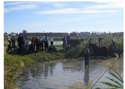
Diversas actividades realizadas durante el festival del fanguero en la finca de Riet Vell

El pasado 29 de noviembre se realizó la elaboración de nuestra cosecha de arroz de este año en el molino de Sant Jaume, de la Camara Arroceras del Montsià. Finalmente se han producido 26.500 kilos de arroz blanco y 22.000 de arroz integral, con unos rendimientos mejores que en la elaboración del